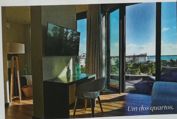
Um dos quartos.