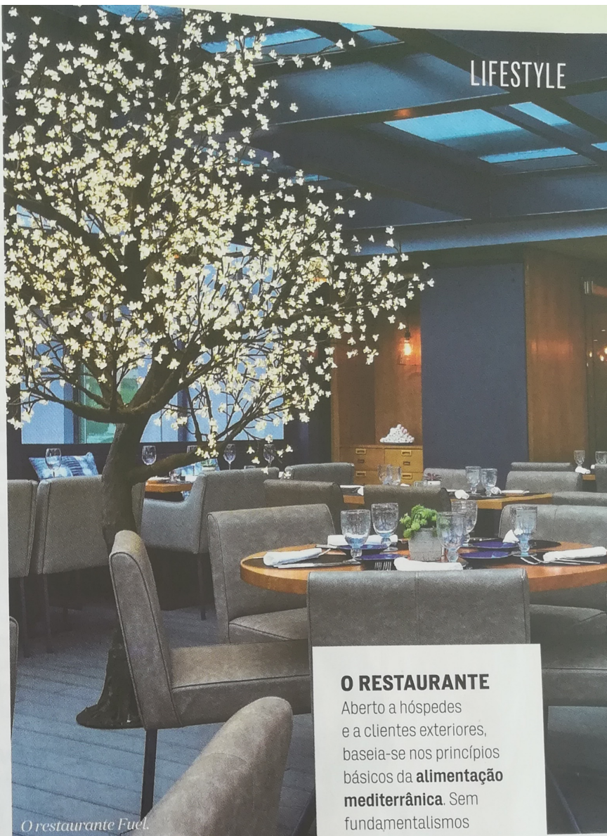
O restaurante Fuel.

Em o Algarve não tem de envolver necessariamente bolas de Berlim consumidas entre dois sonos na toalha de praia. Agora que o verão já lá vai, rume até Monte Gordo mas foque a atenção noutros pontos altos da região. A menos de 500 metros da praia – vá até lá, mas agora que não há bolas, opte por uma caminhada à beira-mar –, o The Prime Energize ( thepriemhotels.com ) foi todo pensado para quem faz questão de ter uma vida saudável, mesmo de férias. O nome do hotel é motivador, o restaurante Fuel fornece o “combustível” necessário sem excessos e os programas de fitness e de spa são irresistíveis. ■